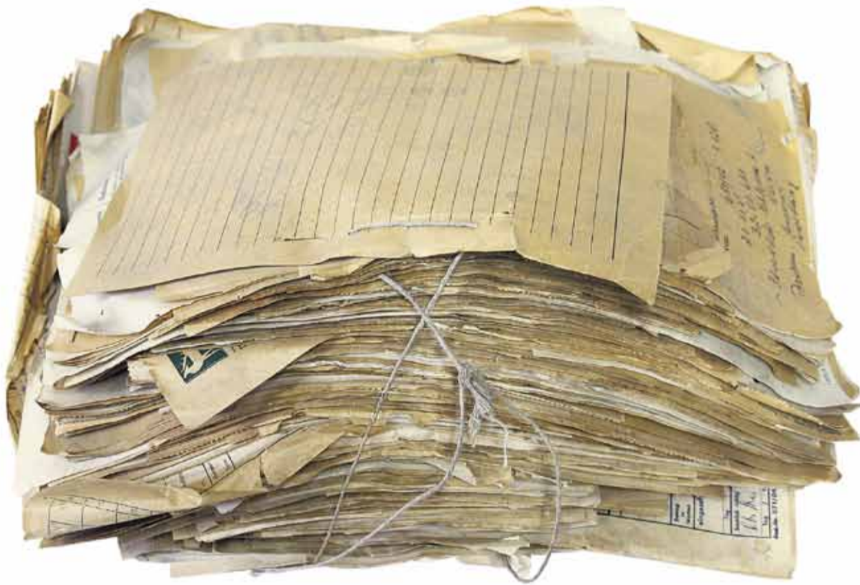
Aktenbündel aus den 1960er-Jahren, inzwischen umgebettet in alterungsbeständige Archivverpackungen

Bauakten, Finanzpläne, Personalunterlagen, Gutachten, Rechnungen: Im Archiv der Stiftung Preußische Schlösser und Gärten Berlin-Brandenburg (SPSPG) lagert ein Jahrhundert eigene Verwaltungsgeschichte. Amtliche Schriftstücke digital erfassen und registrieren, für archivwürdig befinden, inhaltlich erschließen, dauerhaft verwahren und zur Benutzung bereitstellen: Ist das nicht eine trockene oder sogar »staubrockene« Aufgabe? Nicht für Sven Olaf Oehlsen. Der Archivar betreut seit zehn Jahren mit Leidenschaft und – die Klischees kennt er – »ohne Ärmelschoner und Hornbrille« seine »Schatzkammer«. In einem hohen Raum mit langem schmalen Gang und beidseitiger Rollregalanlage gibt es hinter deren Stahltüren Platz für 1500 laufende Meter an Aktenmaterial. »Rund 100 Meter an Unterlagen kommen jedes Jahr hinzu«, sagt Oehlsen. »Es wird aber auch gut eine Tonne Papier im Jahr vernichtet.«