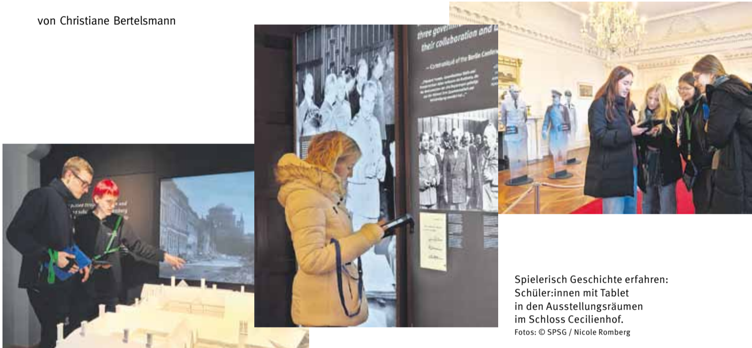
Spielerisch Geschichte erfahren: Schüler:innen mit Tablet in den Ausstellungsräumen im Schloss Cecilienhof.