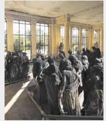
Im Wartestand: Skulpturen im Orangerieschloss. Foto © SPSPG / Leo Seidel Blick in die Zukunft: Entwurf für das neue Skulpturendepot des Berliner Büros Staab Architekten. Visualisierung: © Staab Architekten