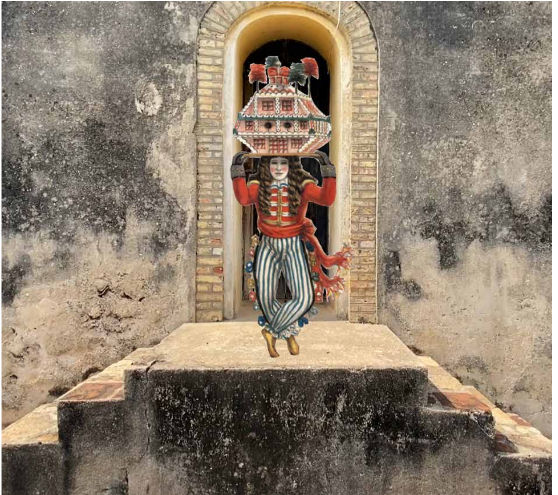
Aus dem Entwurf für »Ahuntahunta: The Ghosts we left Behind« © Jere Ikongio, Rebecca Pokua Korang und Selou Sowe