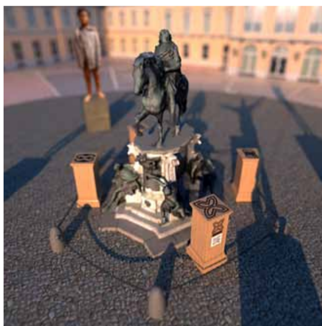
Aus dem Entwurf für »Tears // Fruits of Transformation« © Musquiqui Chihying und Gregor Kasper / VG Bildkunst