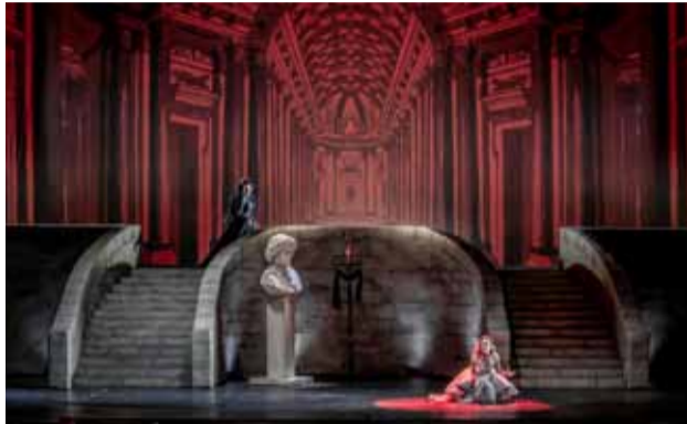
Bühnenbild der Oper »Silla«