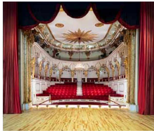
Schlosstheater im Neuen Palais