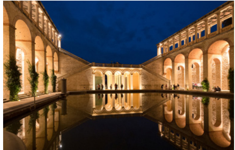
In der Mondnacht wird es romantisch auf dem Pfingstberg.