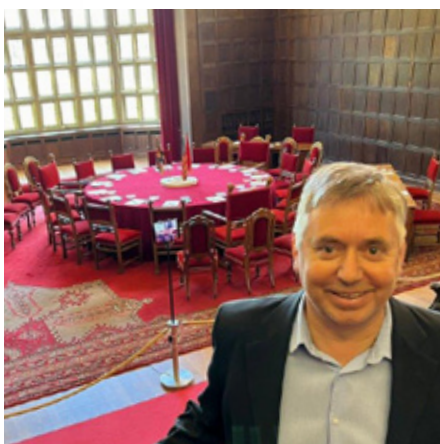
Schloss Cecilienhof wurde 1913 bis 1917 im englischen Landhausstil errichtet.

Im Sommer 1945 fand hier das Gipfeltreffen der Hauptsiegermächte des Zweiten Weltkrieges statt.