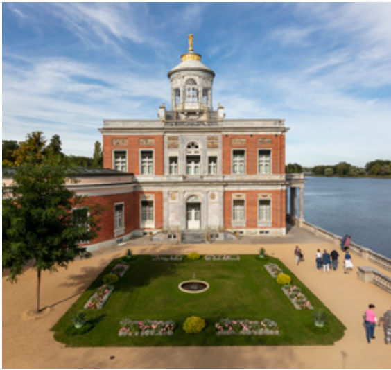
Blick auf Schloss Sanssouci. Friedrich II. verbrachte hier bis zu seinem Tod die Sommermonate

© SPSG / André Stiebitz Das Marmorpalais im Neuen Garten © SPSG / André Stiebitz Das Dampfmaschinenhaus an der Neustädter Havelbucht © SPSG / Virginie Mühlbrodt Schloss Babelsberg © SPSG / Hans Bach