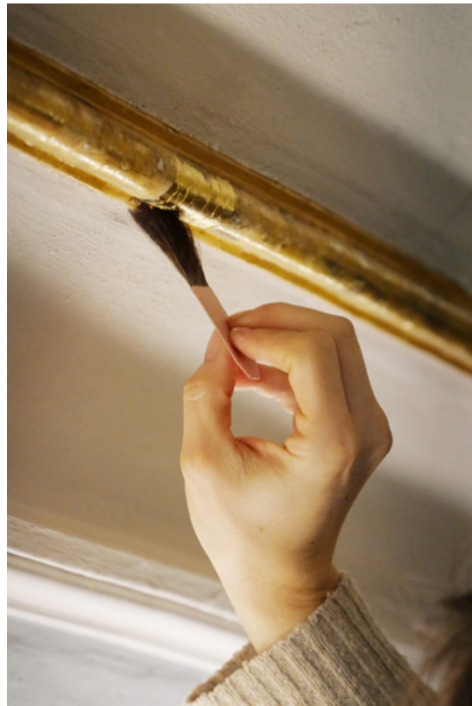
Mit viel Fingerspitzengefühl und Geduld verputzt die Diplom-Restauratorin Friederike Hänold die Leisten und trägt hauchdünnes Gold auf.