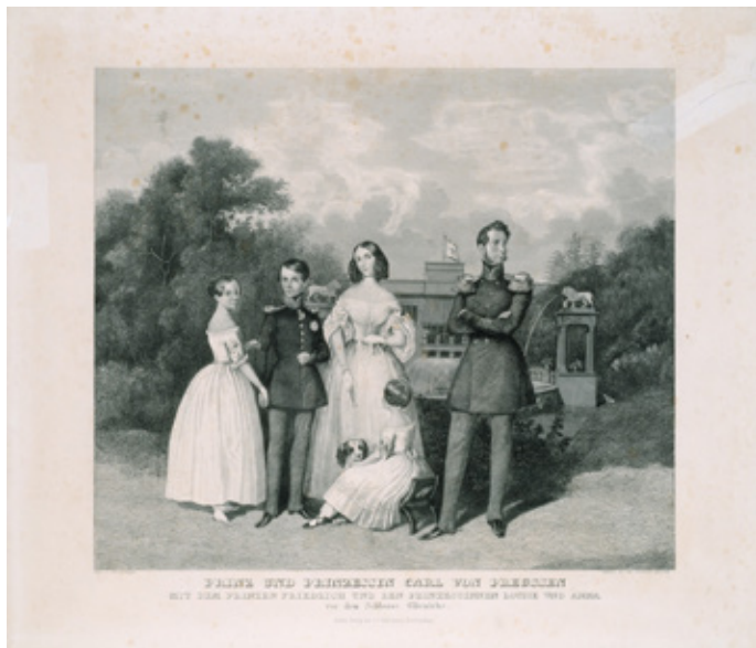
Prinz Carl von Preußen (rechts) mit seiner Familie vor dem Schloss Glienicke, um 1842

Nach dem Bau der Berliner Mauer 1961 durchschnitten Grenzanlagen auch Teile der historischen Gärten und Parks in Potsdam. Die SPSG hat sich zum Ziel gesetzt, diese Geschichte des heutigen UNESCO-Welterbes zu vermitteln und darüber mit ihren Gästen ins Gespräch zu kommen. Mit der App »Border Zone« können die Besuchenden des Parks dessen wechselvolle Geschichte in der Zeit der deutschen Teilung nachvollziehen. Die Verbindung von Vergangenheit und Gegenwart durch Augmented-Reality-Technologie macht dabei verlorene oder verborgene Spuren dieser Vergangenheit wieder sichtbar. Die Game-App ist in den App Stores verfügbar, kann dort kostenlos heruntergeladen und an einem beliebigen Punkt im Park Babelsberg gestartet werden! Empfohlen ab 12 Jahren.