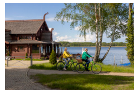
Am Jungfernsee entlang

Weitere Informationen: spsg.de/schloss-glienicke