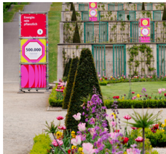
Motiv: © SPSG/Julius Burchard