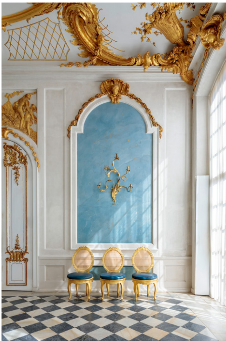
Die Blaue Galerie in den Neuen Kammern von Sanssouci