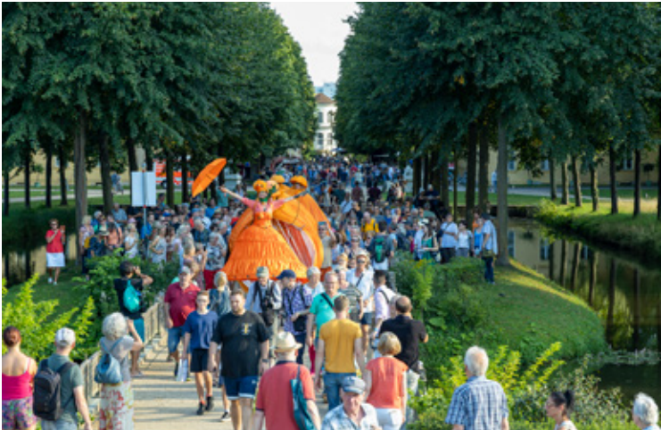
Das Spektakel kann beginnen.